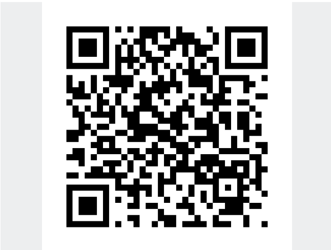
360° Grundriss beispielhaft