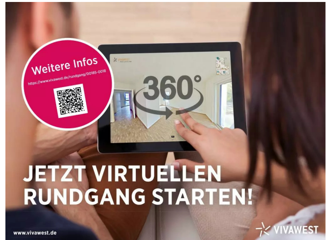
360° Grundriss beispielhaft