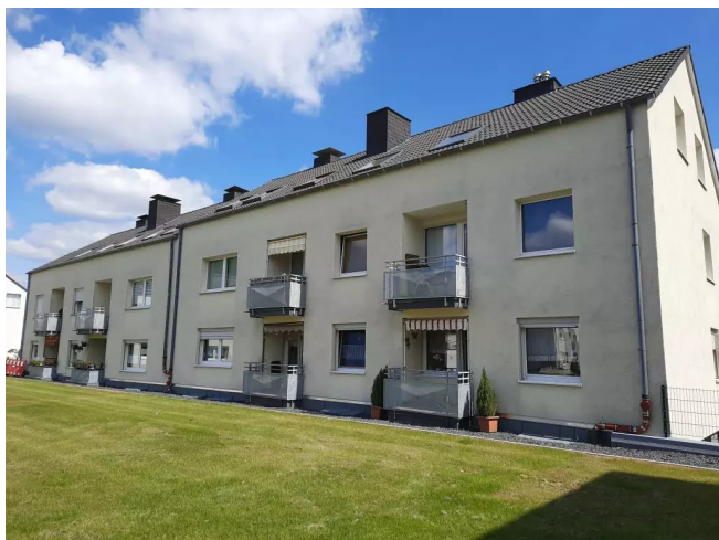
In den Weidbüschen 23+21 Balko