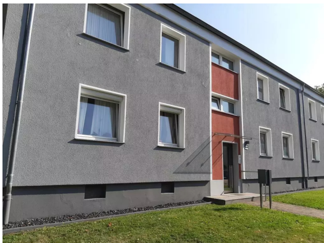
Oberhauser Str. 44