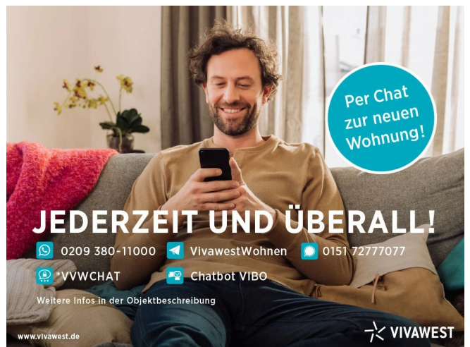
Bild Messenger Internetanzeige