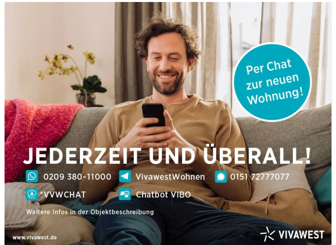
Bild Messenger Internetanzeige