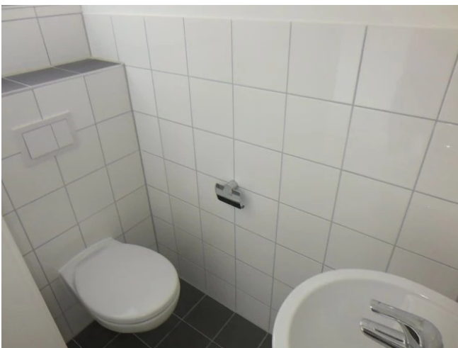
separates WC Beispiel