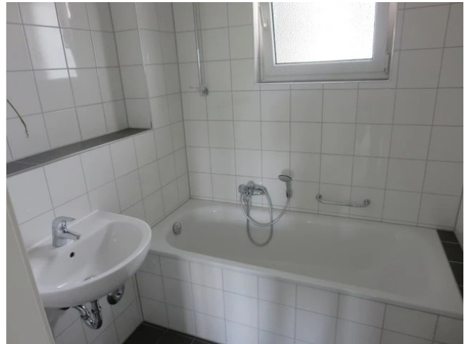
Wannenbad mit Fenster Beispiel