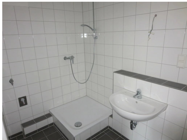
Duschbad innenliegend Beispiel