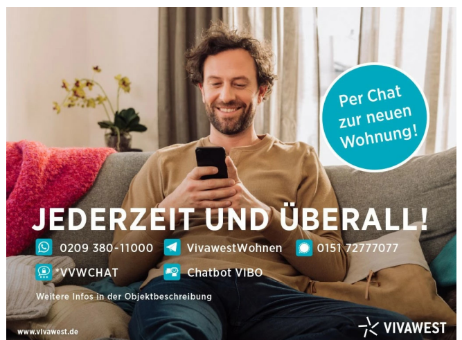
Kontakt per Messenger!