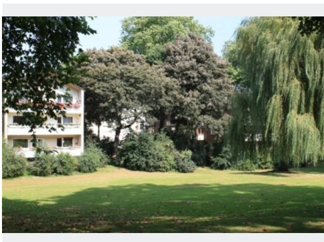
Blick in die Grünanlage