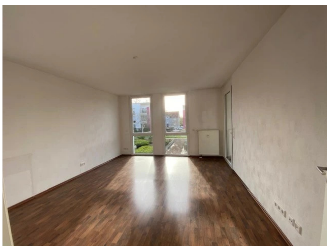
Wohnzimmer - Muster