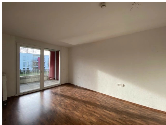
Schlafzimmer - Muster