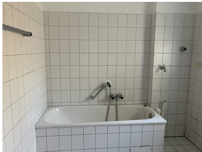
Bad mit Badewanne und Fenster