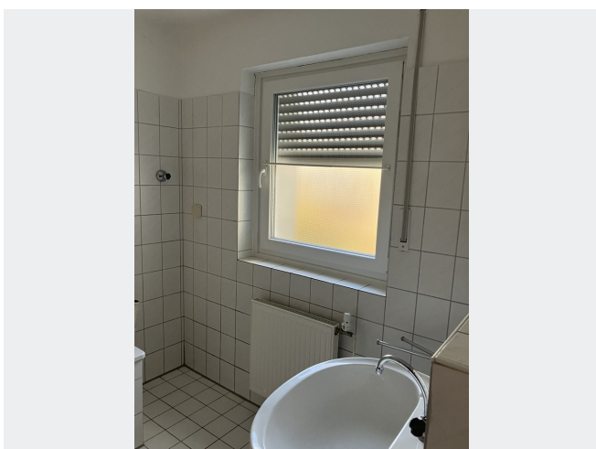
Bad mit Badewanne und Fenster