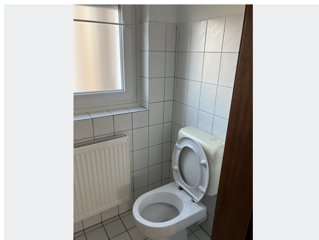
Separates WC mit Waschbecken