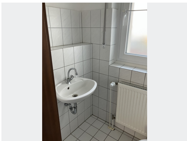
Separates WC mit Waschbecken