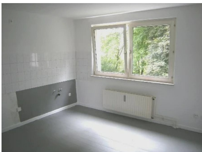
Wohnküche Bild 1