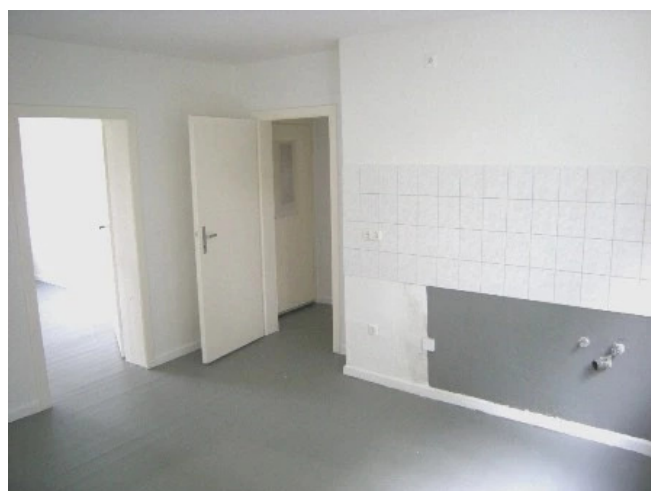
Wohnküche Bild 2