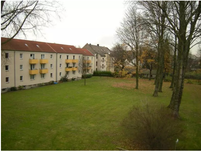
Balkonausblick ins Grüne