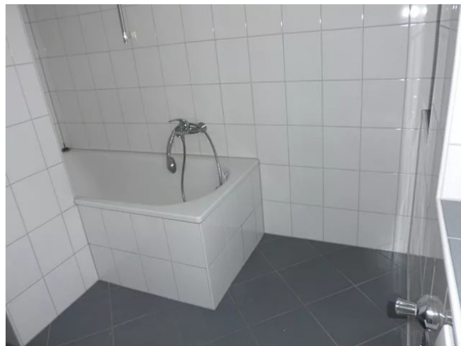
Badezimmer Bild 2