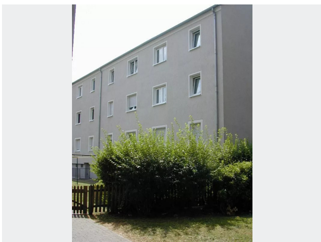
Gebäude Bild 2