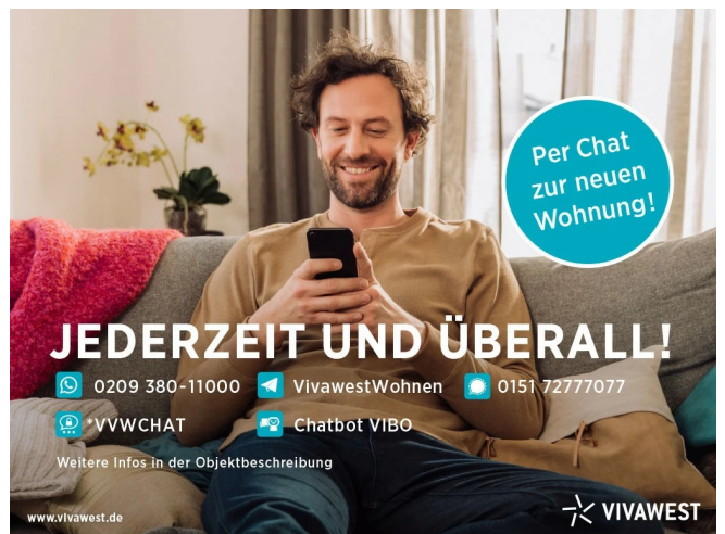
Kontakt per Messenger!