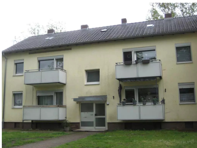
Römerstr. 148 Ansicht