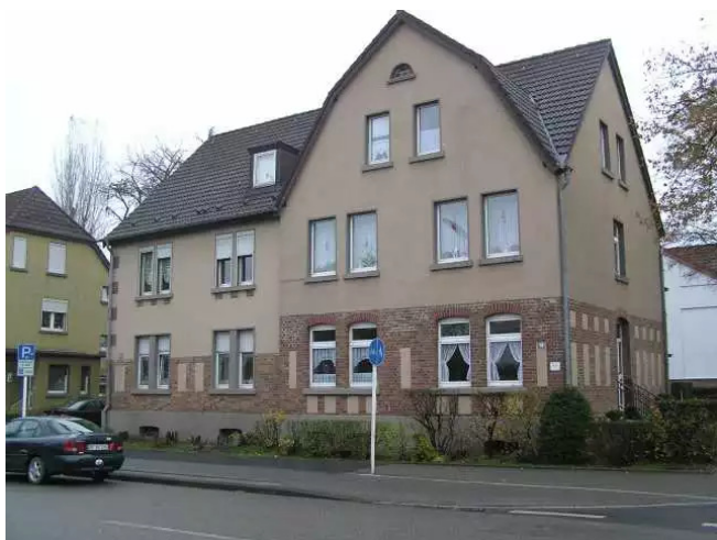
Vorderansicht des Hauses