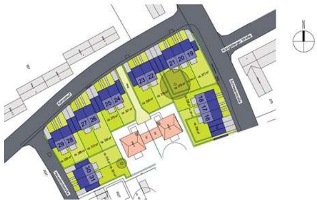
Lageplan Voerde online