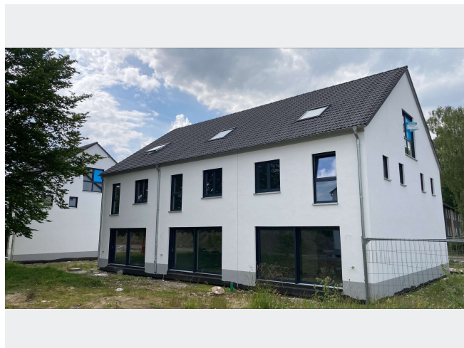
Scan vom 2024-06-13 04_23_36 P