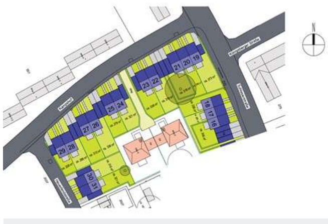
Lageplan Voerde online