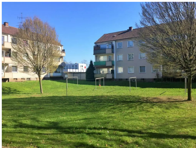
Grünfläche hinter den Häusern